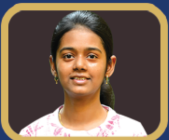
ବିଦ୍ୟା ଭାରତ ସମ୍ମାନ ପ୍ରଞ୍ଜା ପାଠଶିଳା ଚିଲି (+୨ ବିଜ୍ଞାନ)