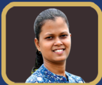
ବିଦ୍ୟା ଭାରତ ସମ୍ମାନ ସିଲ୍ପା ମାତୁ (+୨ ବାରିକା)