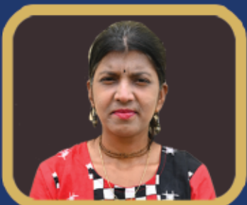
ଜ୍ଞାନ ଭାରତ ସମ୍ମାନ ସୁଶ୍ରୀ ବିଭାଭାଗୀ ପାତ୍ର (ପର୍ବତାରୋହୀ)