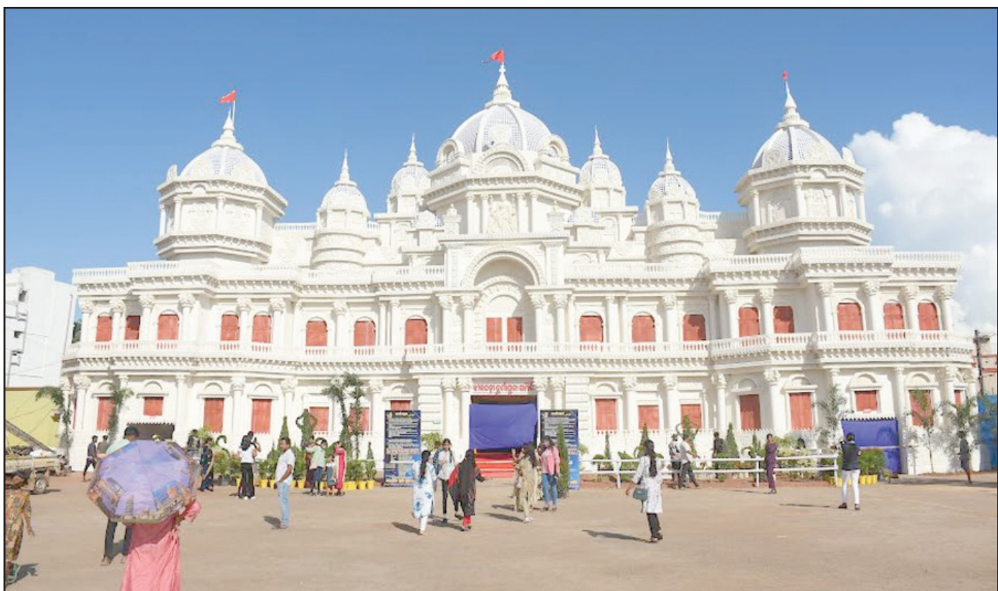
ଭୁବନେଶ୍ୱର ବନିଖାଳ ଓ ଝାରପଡ଼ା ଦୁର୍ଗା ପୂଜା ସମିତିର ଆକର୍ଷଣୀୟ ପୂଜା ମଣ୍ଡପ