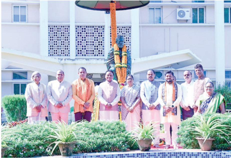
ଉତ୍କଳମଣି ପଣ୍ଡିତ ଗୋପବନ୍ଧୁଙ୍କ ଜୟନ୍ତୀ ଅବସରରେ ବିଧାନସଭା ପରିସରରେ ଗୋପବନ୍ଧୁଙ୍କ ପ୍ରତିମୂର୍ତ୍ତୀର ମୁଖ୍ୟମନ୍ତ୍ରୀ ମୋହନ ଚରଣ ମାଝୀ ଏବଂ ବାଚସ୍ପତି ସୁରମା ପାଢ଼ୀ ପୁଷ୍ପ ମାଲ୍ୟ ଦେଇ ଶ୍ରଦ୍ଧାଞ୍ଜଳି ଅର୍ପଣ କରୁଛନ୍ତି ।