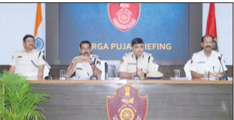
ପୋଲିସ୍ କମିଶନର ଉପାଧ୍ୟକ୍ଷଙ୍କ ଦ୍ୱାରା ପରାମର୍ଶ ଦେଇଥିଲେ । ପାଣ୍ଡେଲିଂ ବୃଦ୍ଧି କରାଯିବା ସହ ମୁଖ୍ୟ ସ୍ଥାନଗୁଡ଼ିକରେ ସିସିଟିଭି ଲଗାଯାଇଛି, ସେଥିପ୍ରତି ମଧ୍ୟ ନଜର ରଖିବେ ।

ଭୁବନେଶ୍ୱର, (ସପ୍ତ) : ଦୁର୍ଗାପୂଜା ସୁରକ୍ଷା ପାଇଁ ରୁଧିରୀ ପୋଲିସ୍ ଦେବା ଭବନରେ ଭୁବନେଶ୍ୱର ସମସ୍ତ ଥାନା ଅଫିସର, ଏସିପି ଓ ଅନ୍ୟାନ୍ୟ କେତେକ ଅଫିସରଙ୍କୁ ନେଇ ଏକ ବଡ଼ସରଣ ବୈଠକ ହୋଇଥିଲା ।