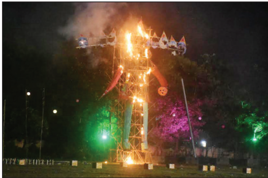
ବରପୁଣ୍ଡାରେ ରାବଣପୋଡ଼ି ଉତ୍ସବ