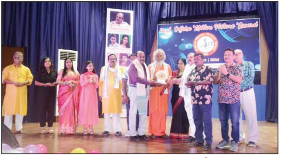
ମାଂସ ଉତ୍ପାଦନ ପକ୍ଷରୁ ପ୍ରମୁଖ ମେଳାକୁ ଲାଲପତାଳୀ ଆତିଥିମଣ୍ଡଳ ଆଠଟିଏ ପ୍ରଦାନ କରାଯାଇଛି

ଏଆଇ ଟେକ୍ନୋଲୋଜିକୁ ବ୍ୟବହାର କରିବା ଦିଗରେ ଭାରତ ସରକାରଙ୍କ ଶିକ୍ଷା ମନ୍ତ୍ରାଳୟ ପକ୍ଷରୁ ବଡ଼ ପଦକ୍ଷେପ ନିଆଯାଇଛି । କେନ୍ଦ୍ର ଶିକ୍ଷା ମନ୍ତ୍ରୀ ଧର୍ମେନ୍ଦ୍ର ପ୍ରଧାନ ନୂଆଦିଲ୍ଲୀ ଠାରେ ସ୍ୱାସ୍ଥ୍ୟସେବା, କୃଷି ଏବଂ ସ୍ତ୍ରୀ ସହର କ୍ଷେତ୍ରକୁ ବିଶେଷ ଚିତ୍ତ ଦେଇ କହିଛନ୍ତି । ଏଆଇ ଟେକ୍ନୋଲୋଜିକୁ ବ୍ୟବହାର କରିବା ଦିଗରେ ଭାରତ ସରକାରଙ୍କ ଶିକ୍ଷା ମନ୍ତ୍ରାଳୟ ପକ୍ଷରୁ ବଡ଼ ପଦକ୍ଷେପ ନିଆଯାଇଛି ।