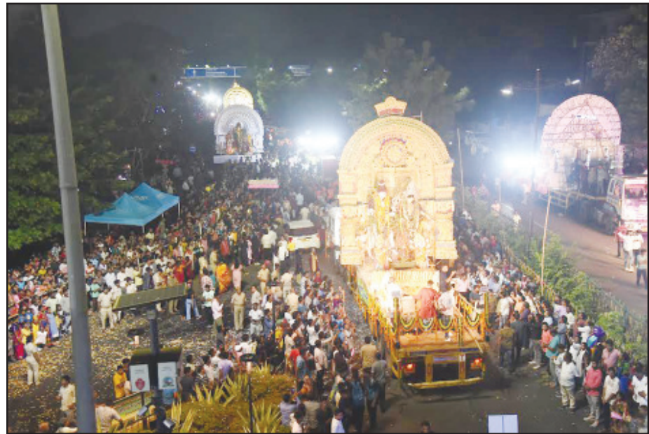
ଭୁବନେଶ୍ୱରରେ ଭାସାଣା ଉତ୍ସବ