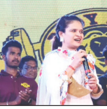
ଖୋର୍ଦ୍ଧା ଜିଲ୍ଲାକୁ ଏକ ଆଦର୍ଶ ଜିଲ୍ଲା ଭାବେ ଗଢ଼ି ତୋଳିବା ପାଇଁ ପ୍ରୟାସ ଜାରି ରହିବ : ଏସପି

ଖୋର୍ଦ୍ଧା (ସମ୍ବୁଧ): ପବିତ୍ର ବିଜୟା ଦଶମୀ ଅବସରରେ ସ୍ଥାନୀୟ ହାବେକା ପତିଆଠାରେ ସୋହାଗୋ ଅନୁଷ୍ଠାନ ବଡ଼ିଜୋନ ପକ୍ଷରୁ ୨୦ତମ ରାବଣାପୋଡ଼ି ଉତ୍ସବ ପାଳନ କରାଯାଇଛି । ଏହାପରେ ଯୁବକଙ୍କୁ ମୃତ୍ୟୁ ଦଣ୍ଡ ଦିଆଯାଇଛି । ଏହାପରେ ଯୁବକଙ୍କୁ ମୃତ୍ୟୁ ଦଣ୍ଡ ଦିଆଯାଇଛି । ଏହାପରେ ଯୁବକଙ୍କୁ ମୃତ୍ୟୁ ଦଣ୍ଡ ଦିଆଯାଇଛି । ଏହାପରେ ଯୁବକଙ୍କୁ ମୃତ୍ୟୁ ଦଣ୍ଡ ଦିଆଯାଇଛି ।