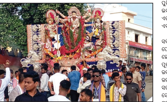
ପୂଜା ପାଠପଢ଼ା ୧୪ଟି ମୂର୍ତ୍ତି ବିସର୍ଜିତ ହୋଇଥିଲା । ୧୪ ତାରିଖ ରାତି ୧୨ ରୁ ୧୩ ରୁ ମୁଖ୍ୟମା ମୂର୍ତ୍ତି ବିସର୍ଜନ କରାଯାଇଥିଲା । ସହରର ବିଭିନ୍ନ ସ୍ଥାନରେ ଦକ୍ଷିଣ ଭିଡ଼ି ଖେଳରେ ମେଡ଼ଗୁଡ଼ିକୁ ସମର୍ପଣ କରାଯାଇଥିଲା । ବିସର୍ଜନ ପାଇଁ ବିସର୍ଜିତ ପକ୍ଷରୁ ଦେବୀଗଡ଼ାଠାରେ ଗାଁ ଅଗ୍ରୀୟା ପୋଖରୀ ନିମନ୍ତ କରାଯାଇଥିଲା । ଭବାଣୀ ଶୋଭାଯାତ୍ରାକୁ ଶାନ୍ତିଶୁଖାବର ସହ ସମ୍ପନ୍ନ କରାଯିବ । ପାଠିକ ସହରରେ ୭୦୦ ପୂର୍ଣ୍ଣିମ ଭଲୁକ୍ଷିଆର (ସେଲ୍‌ସେବା)କୁ ମଧ୍ୟ ଶୋଭାଯାତ୍ରାରେ ଶେଖାଯାତ୍ରାକୁ ନିୟନ୍ତ୍ରଣ କରାଯାଇଥିଲା ।

ଶୋଭାଯାତ୍ରାରେ ଶେଖାଯାତ୍ରାକୁ ନିୟନ୍ତ୍ରଣ କରାଯାଇଥିଲା । ଏହାପରେ ପ୍ରାଫିକ ପରିଚାଳନାରେ ସହଯୋଗ କରିବା ପାଇଁ ୭୦୦ ପୂର୍ଣ୍ଣିମ ଭଲୁକ୍ଷିଆର (ସେଲ୍‌ସେବା)କୁ ମଧ୍ୟ ଶୋଭାଯାତ୍ରାରେ ଶେଖାଯାତ୍ରାକୁ ନିୟନ୍ତ୍ରଣ କରାଯାଇଥିଲା ।