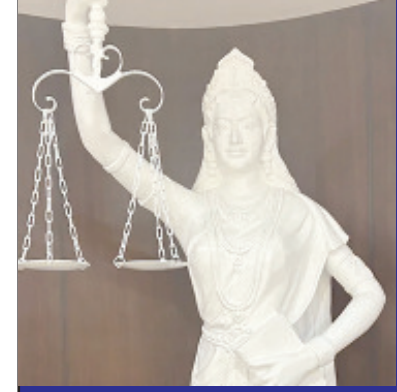
ବିଚାରପତି କର୍ମସୂତ୍ର ତିୱାଳ ଚନ୍ଦ୍ରଚୂଡ଼ ପରାମର୍ଶ ଦେଇଥିଲେ। ସେହି ଅନୁସାରେ ନ୍ୟାୟ ଦେବାଙ୍କ

ନୂଆଦିଲ୍ଲୀ: ଭାରତୀୟ ଆଇନ ଅନ୍ତର୍ଭୁକ୍ତ ନ୍ୟାୟ ଦେବୀ ସମସ୍ତଙ୍କ ବିଚାର ଠିକ ଭାବେ କରନ୍ତି। ଏହି ବାର୍ତ୍ତା ଏଣିକି ଲୋକଙ୍କ ପାଖରେ ପହଞ୍ଚିବ।