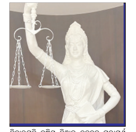
ବିଚାରପତି କର୍ଣ୍ଣସ୍ୱ ବିଧାନ ଚରୁଚୂଡ଼ ପରାମର୍ଶ ଦେଇଥିଲେ ।

ନୂଆଦିଲ୍ଲୀ: ଭାରତୀୟ ଆଇନ ଅନ୍ଧ ନୁହେଁ । ନ୍ୟାୟ ଦେବା ସମସ୍ତଙ୍କ ବିଚାର ଠିକ ଭାବେ କରନ୍ତି । ଏହି ବାଣୀ ଏଣିକି ଲୋକଙ୍କ ପାଖରେ ପହଞ୍ଚିବ ।