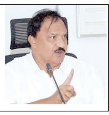
ମୁଖ୍ୟମନ୍ତ୍ରୀଙ୍କ ସାମ୍ମୁଖରେ ଉପସାଧନ