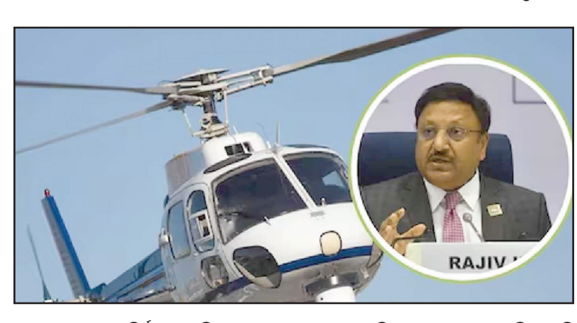
ହେଲିକପ୍ଟର ମିଳାମ ଗୁାସିୟର ଅଭିମୁଖେ ଯିବାର ଥିଲା ଯେତେବେଳେ ଖରାପ ପାଗ ଯୋଗୁ ପାଇଲଟ ଠିକ ଭାବେ ଆଗକୁ ଦେଖି ପାରି ନଥିଲେ ।

ନୂଆଦିଲ୍ଲୀ: ହେଲିକପ୍ଟର ମିଳାମ ଗୁାସିୟର ଅଭିମୁଖେ ଯିବାର ଥିଲା ଯେତେବେଳେ ଖରାପ ପାଗ ଯୋଗୁ ପାଇଲଟ ଠିକ ଭାବେ ଆଗକୁ ଦେଖି ପାରି ନଥିଲେ ।