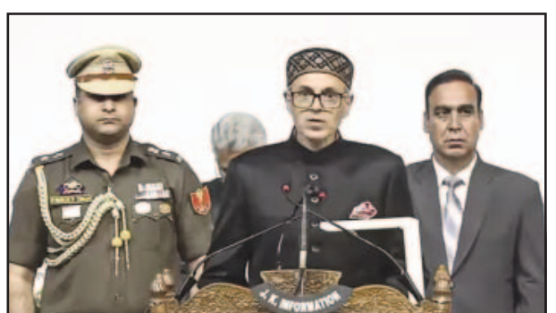
ପାର୍ଟିର ଅଧିକେଶ ଯାଦବ ପ୍ରମୁଖ ଏଥିରେ ସାମିଲ ହୋଇଥିଲେ । ଓମାର ଅବଦୁଲ୍ଲାଙ୍କ ସମେତ ୫୫ଜଣ ଦେଇଛନ୍ତି ଯେ ତାଙ୍କ ଯିବା ଆସିବା ବେଳେ ପୋଲିସ୍ କୌଶଳି ପ୍ରକାର ଗ୍ରାହଣ କରିବେ (୯ ପୃଷ୍ଠାରେ)

ଶପଥ ଗ୍ରହଣ ଉପରେ ଲକ୍ଷିଆ ମେଣ୍ଟର ନେତାମାନେ ମଧ୍ୟ ଉପସ୍ଥିତ ଥିଲେ । କଂଗ୍ରେସର ରାହୁଲ ଗାନ୍ଧି, ପ୍ରିୟଙ୍କା ଗାନ୍ଧି, ଆପ୍‌ର ସଞ୍ଜୟ ସିଂ, ସମାଜବାଦୀ ବିଧାୟକ ମଧ୍ୟ ମନ୍ତ୍ରୀ ଭାବେ ଶପଥ ନେଇଛନ୍ତି । ଶପଥ ନେଲା ପରେ ଓମାର ଅବଦୁଲ୍ଲାଙ୍କ ପ୍ରଥମ ନିର୍ଦ୍ଦେଶ ଚର୍ଚ୍ଚା ପାଇଛି । ସେ ନିର୍ଦ୍ଦେଶ