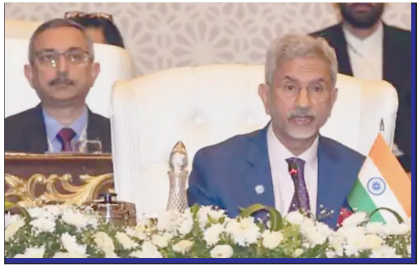
ଦିଲ୍ଲୀରେ ୫ ଯୋଜିତ ଆଡକ୍ଟରାଦ ବିନାଶ ବିନା ବିକାଶ ଅସମ୍ଭବ