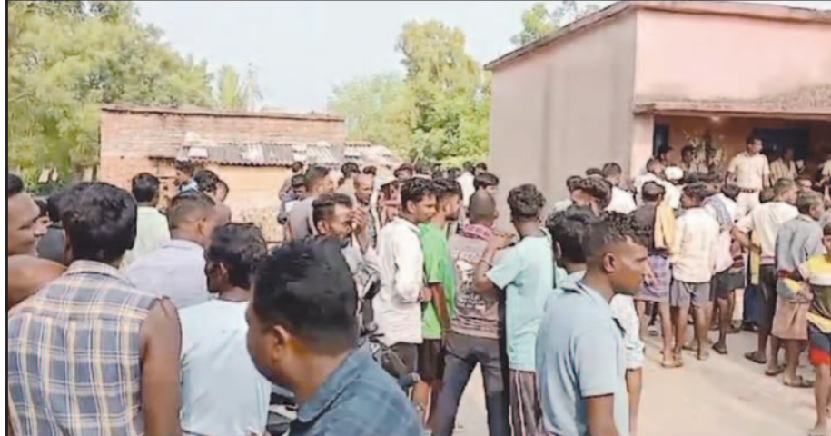
ନାବାଳକ ଏକ ବାଇକ୍ ରେ ଆସି ଆନନ୍ଦନଗର ଗାଁ ପାଖ ଦେଇ ଯାଇଥିବା ରାସ୍ତା ପାର୍ଶ୍ୱରେ ଛିଡ଼ା ହୋଇଥିଲେ । ଆଉ ସେହି ରାସ୍ତାରେ ଯିବା ଆସିବା କରୁଥିବା ଲୋକଙ୍କୁ ନାନା ହଇରାଣ କରୁଥିଲେ । ରାତିର ଅନ୍ଧାରରେ ଯେଉଁ ରାସ୍ତାରେ ଯିବା ଆସିବା କରୁଥିବା ଲୋକଙ୍କୁ ନାନା ହଇରାଣ କରୁଥିଲେ । ରାତିର ଅନ୍ଧାରରେ

ସୋନପୁର, ୧୬ ଅକ୍ଟୋ (ସମ୍ବୁଧ) : ସୁବର୍ଣ୍ଣପୁର ଜିଲ୍ଲା ବିକିକା ଥାନା ଆନନ୍ଦନଗରରେ ଚାଟିଲେ ଗାଁ ଲୋକେ । ୩ ଡକାୟତଙ୍କ ସମେତ ପୁଲିସ୍‌ଙ୍କୁ ଗୋଡ଼ାଳ ପିଟିଲେ । ପୁଲିସ୍ ଗାଡ଼ିକୁ ଭାଙ୍ଗିଲେ । ଗାଁ ଲୋକଙ୍କ ଆକ୍ରମଣରେ ଦୁଇ ପୁଲିସ୍ ଏବସିଆଇ ଗୁରୁତର ଆହତ ହୋଇଛନ୍ତି । ପରେ ପୁଲିସ୍ ଫୋର୍ସ ଯାଇ ଲାଠି ଚାର୍ଜ କରି ଉତ୍ତମ ଲୋକଙ୍କ କବଳରୁ ୩ ଚୋର ଓ ଆହତ ହୋଇଥିବା ଦୁଇ ଏବସିଆଇ ଏବଂ ଅନ୍ୟ ପୁଲିସ୍ କର୍ମଚାରୀଙ୍କୁ ଉଦ୍ଧାର କରିଥିଲେ । ଗାଁ ଲୋକଙ୍କ କହିବା ଅନୁସାରେ ମଙ୍ଗଳବାର ରାତି ପ୍ରାୟ ୧୨ଟା ହେବା ୩ ଜଣ