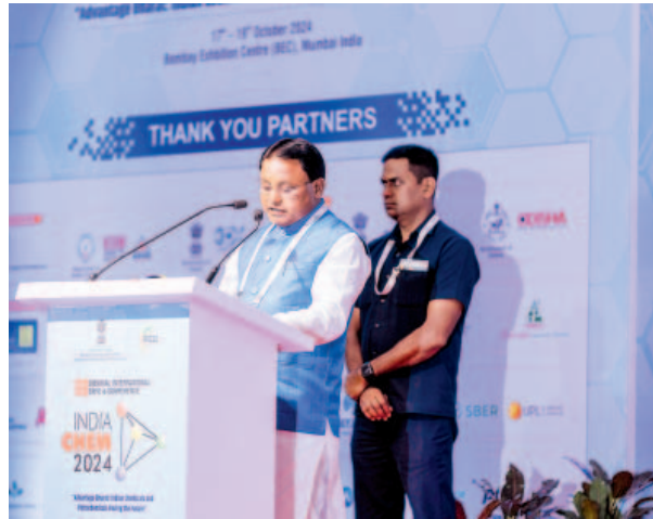
ସମ୍ପଦରେ ଭରପୂର ଓଡ଼ିଶା ବିଭିନ୍ନ ଶିଳ୍ପକ୍ଷେତ୍ରରେ ଅଗ୍ରଣୀ ରହିଛି । ଖଣି ଓ ଧାତବ କ୍ଷେତ୍ରରେ ଓଡ଼ିଶା ଆଗରେ

ଭୁବନେଶ୍ୱର, ୧୮।୧୦ (ସହ୍ୟ) : ଭାରତର ଶିଳ୍ପ ଅଭିବୃଦ୍ଧି କ୍ଷେତ୍ରରେ ଓଡ଼ିଶା ପ୍ରମୁଖ ଭୂମିକା ପ୍ରଦାନ କରିବାକୁ ପ୍ରସ୍ତୁତ ହୋଇ ରହିଛି । ବିକଶିତ ଭାରତ ଯାତ୍ରାରେ ଓଡ଼ିଶା ଆଗୁଆ ରହିବ ବୋଲି ମୁଖ୍ୟମନ୍ତ୍ରୀ ମୋହନ ଚରଣ ମାଝୀ କହିଛନ୍ତି । ମୁଖ୍ୟମନ୍ତ୍ରୀ ଅନୁଷ୍ଠିତ ଇଣ୍ଡିଆ କେମ୍-୨୦୨୪ ସମ୍ମିଳନୀରେ ଯୋଗଦେଇ ମୁଖ୍ୟମନ୍ତ୍ରୀ କହିଛନ୍ତି ଯେ ପ୍ରଧାନମନ୍ତ୍ରୀ ନରେନ୍ଦ୍ର ମୋଦିଙ୍କ ଦୂରଦୃଷ୍ଟି ସମ୍ପର୍କରେ ନେତୃତ୍ୱରେ ପୂର୍ବୋଦ୍ଦେଶ୍ୟ ଏକ ନୂତନ ଯୁଗ ଆରମ୍ଭ ହୋଇଛି । ପୂର୍ବ ଭାରତରେ ଏହା ନୂତନ ଯୁଗରେ ନେବାକୁ ଯାଉଛି । ପ୍ରାକୃତିକ