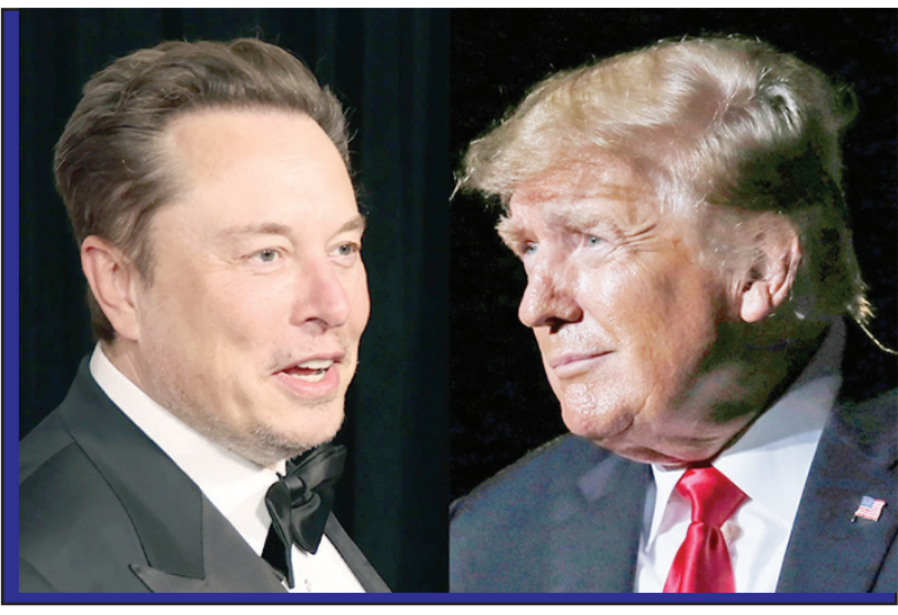
ପେନସିଲଭାନିଆରେ ଏହି ଅଭିଯାନ ଆରମ୍ଭ କରିଛନ୍ତି । ସେଥିପାଇଁ ଭୋଟରଙ୍କୁ ପଞ୍ଜୀକୃତ କରିବାକୁ ପଡ଼ିବ ।

ହେବା ପର୍ଯ୍ୟନ୍ତ ପ୍ରତିଦିନ ୧ ମିଲିୟନ ଡଲାର ପୁରସ୍କାର ଦିଆଯିବାର ସୁଯୋଗ ପ୍ରଦାନ କରାଯିବ । ଜଣେ ଭୋଟରଙ୍କୁ ଏନେଇ ମନୋନୀତ କରାଯିବ । ଏହାର ସର୍ତ୍ତ ହେଉଛି ଯେ ସେମାନଙ୍କୁ ମୁକ୍ତ ବସ୍ତୁତା ଅତ୍ୟନ୍ତ ରଖିବାର ଅଧିକାରକୁ ସମର୍ଥନ କରିବାକୁ ଏକ ଆବେଦନପତ୍ରରେ ସମ୍ମତ କରିବାକୁ ପଡ଼ିବ । ସେ ପ୍ରତିଶ୍ରୁତି କରିଥିବା 'ଆମେରିକା' ରାଜନୈତିକ କାର୍ଯ୍ୟକର୍ତ୍ତା (ପିଏସି) ଜରିଆରେ ଏଲୋନ୍ ମସ୍କ ପ୍ରଥମ ପୁରସ୍କାର ଜରିଆରେ ଏହାର ପ୍ରଦାନ କରିଥିବା ଜଣାଯାଇଛି । ନିର୍ବାଚନ ପ୍ରଦାନ ପାଇଁ ପିଏସି ଅର୍ଥ ସଂଗ୍ରହ କରିବାରେ ସାହାଯ୍ୟ କରେ ଏବଂ ଏଲନ୍ ମସ୍କଙ୍କ କର୍ମଚାରୀଙ୍କୁ ପ୍ରାର୍ଥନା ସମର୍ଥନ କରେ । ମସ୍କଙ୍କର ଏହି ବାଣ୍ଟୋରେ ଖୋଲାଖୋଲି ଭାବେ ଲେଖାଯାଇଛି ଯେ ସେ ନିର୍ବାଚନରେ ଉପହାର ପ୍ରାର୍ଥନା ତଥା ଆମେରିକୀୟ ପୂର୍ବତନ ରାଷ୍ଟ୍ରପତି ଡୋନାଲ୍ଡ ଟ୍ରମ୍ପଙ୍କୁ ସମର୍ଥନ କରୁଛନ୍ତି । ବାରାକ ଓବାମା ଏବଂ ହିଲାରୀ କ୍ଲିଣ୍ଟନଙ୍କ ପରି ଗଣତାନ୍ତ୍ରିକ ପ୍ରାର୍ଥନା ସମର୍ଥକ ଥିବା ଏହି ଉଦ୍ୟୋଗୀ ବର୍ତ୍ତମାନ ଡୋନାଲ୍ଡ ଟ୍ରମ୍ପଙ୍କୁ ଖୋଲାଖୋଲି ସମର୍ଥନ କରିଛନ୍ତି ।