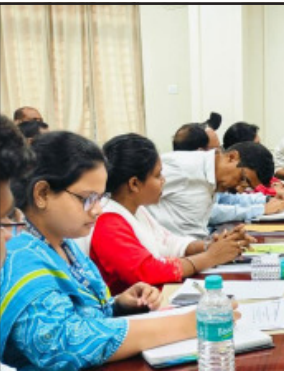
ବାଲେଶ୍ୱର, (ସବୁଧ) : ସମ୍ଭାବ୍ୟ ବାତ୍ୟା ଦାନାକୁ ନେଇ ଜିଲ୍ଲା ସମ୍ବନ୍ଧିଆରମ୍ଭର ମକ୍ତବିଳା ପ୍ରଶାସନର ଗୁରୁତ୍ୱପୂର୍ଣ୍ଣ ବୈଠକ ଅନୁଷ୍ଠାନ କରାଯାଇଛି ।