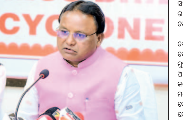
ଧନ୍ୟବାଦ ଦେଇଥିଲେ । ଗଣ ମାଧ୍ୟମ ମଧ୍ୟ ପ୍ରତି ମୁହୂର୍ତ୍ତରେ ଖବର ଦେଇ ଜନ ସାଧାରଣଙ୍କୁ ସଚର୍କ ଓ ସରକାରଙ୍କୁ ପଦକ୍ଷେପ ନେବାକୁ

ଭୁବନେଶ୍ୱର, ୨୫।୧୦ (ସବୁ) : ମୁଖ୍ୟମନ୍ତ୍ରୀ ମୋହନ ଚରଣ ମାଝୀ ଆଜି ସନ୍ଧ୍ୟାରେ ଭଦ୍ରକ ଜିଲ୍ଲା କମିଶନରଙ୍କ କାର୍ଯ୍ୟାଳୟରେ ବାତ୍ୟା ପରିସ୍ଥିତି ଓ ପୁନରୁଦ୍ଧାର କାର୍ଯ୍ୟ ସମୀକ୍ଷା କରିଛନ୍ତି । ସମୀକ୍ଷା ପରେ ଗଣ ମାଧ୍ୟମ ଆଗରେ ନିଜର ବକ୍ତବ୍ୟ ରଖି ମୁଖ୍ୟମନ୍ତ୍ରୀ କହିଲେ ଯେ ମହାପ୍ରଭୁଙ୍କ ଆଶୀର୍ବାଦ ଓ ଜନସାଧାରଣଙ୍କ ସହଯୋଗ ପାଇଁ ଆମେ ବାତ୍ୟା ମୁକାବିଲାରେ ସଫଳ ହୋଇଛୁ । ଆମେ ଆମର ଭିତରା କ୍ୟାଲୁଆରିଟି ଲକ୍ଷ୍ୟ ହାସଲ କରି ପାରିଛୁ । ସେଥିପାଇଁ ମୁଖ୍ୟମନ୍ତ୍ରୀ କର୍ମଚାରୀଙ୍କୁ