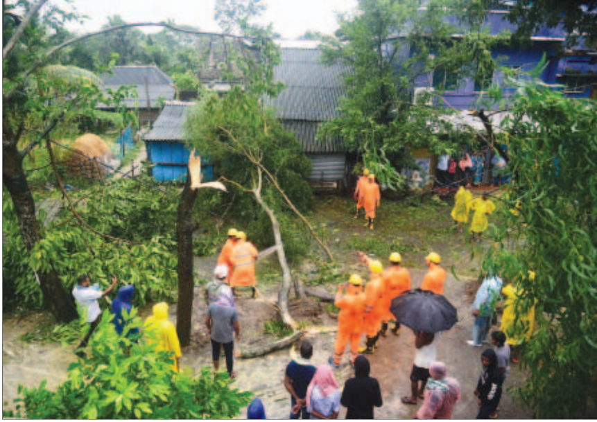
ବାସୁଦେବପୁର-ଲକ୍ଷ୍ମୀପୁରରେ ରାସ୍ତା ସଫା କରୁଛନ୍ତି ଏନ୍ଟିଆରଏଫ୍ ଟିମ୍