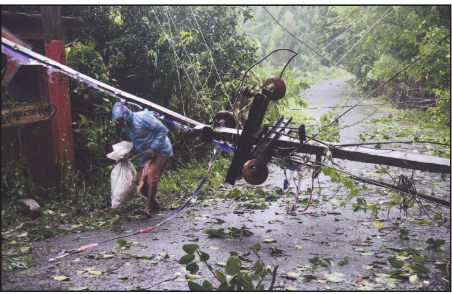
ଭଦ୍ରକ ଜିଲ୍ଲାର ୨୧୮ ପଞ୍ଚାୟତ, ଭଦ୍ରକ ଜିଲ୍ଲାର ୨୧୮ ପଞ୍ଚାୟତ,

ଭୁବନେଶ୍ୱର / ଭଦ୍ରକ / ରାଜନଗର, ୨୫।୧୦ (ସବୁ) : ବାତ୍ୟା 'ଦାନା' ପ୍ରଭାବରେ ପ୍ରବଳ ବେଗରେ ପବନ ଓ ବର୍ଷା ଯୋଗୁ ଭଦ୍ରକ ଜିଲାର ୭ଟି ବ୍ଲକ୍ ବେଶୀ ପ୍ରଭାବିତ ହୋଇଛି । ସେହିପରି ବାଲେଶ୍ୱର ଓ କେନ୍ଦ୍ରପଡ଼ା ଜିଲ୍ଲାରେ ମଧ୍ୟ ପ୍ରଭାବ ପଡ଼ିଛି । ଏହିସବୁ ଜିଲ୍ଲାରେ ଉପକୂଳବର୍ତ୍ତୀ ଅଞ୍ଚଳରେ ବିଦ୍ୟୁତ୍ ସରବରାହ ବ୍ୟାହତ ହୋଇଥିଲା । ଆସନ୍ତାକାଲି(ଶନିବାର) ବାଲେଶ୍ୱର, ଭଦ୍ରକ ଓ କେନ୍ଦ୍ରପଡ଼ା ଜିଲ୍ଲାରେ ପ୍ରବଳ ବର୍ଷା ସମ୍ଭାବନା ଥିବାରୁ ପ୍ରାଥମିକ ଦ୍ୱାଦଶ ଶ୍ରେଣୀ ପର୍ଯ୍ୟନ୍ତ ସ୍କୁଲ ଓ କଲେଜ ଛୁଟି ଘୋଷଣା କରାଯାଇଛି ।