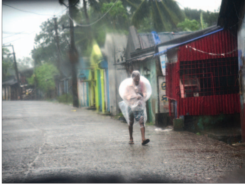
ରାଜନଗରରେ ବାଟାର ପ୍ରଭାବ