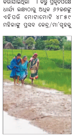
ବାଟ୍ୟା ସମୟରେ ଶୂନ ପ୍ରସବକରିତ ମାତୃ ମୃତ୍ୟୁ