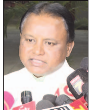
କ୍ଷେତ୍ରରେ ଅଧିକ ପୁଞ୍ଜି ନିବେଶ ପାଇଁ ପ୍ରାଥମିକତାର ସହ ବିଭିନ୍ନ ପୁଞ୍ଜି ନିବେଶକାରୀଙ୍କ ସହ ତ ଆଲୋଚନା କରାଯିବ । ଓଡ଼ିଶାରେ ପୁଞ୍ଜି ଲାଗଣ ତଥା ଶିଳ୍ପ ପ୍ରତିଷ୍ଠା ସମ୍ବନ୍ଧରେ ଥିବା ସକଳାତ୍ମକ ଲକ୍ଷ୍ୟ ସିଷ୍ଟମ ସମ୍ବନ୍ଧରେ ଅବଗତ କରାଯିବ । ୫ ବର୍ଷରେ ୫ ଲକ୍ଷ କୋଟି ପୁଞ୍ଜି ଆକର୍ଷିତ କରିବା (୯ ପୃଷ୍ଠାରେ)

ଭୁବନେଶ୍ୱର, ୨୧୧୦ (ସବୁ୍ୟ) : ରାଜ୍ୟ ଲାଗି ପୁଞ୍ଜି ନିବେଶକୁ ଆକର୍ଷିତ କରିବା ପାଇଁ ମୁଖ୍ୟମନ୍ତ୍ରୀ ମୋହନ ଚରଣ ମାଘୀ ଆଜି ପୁରୀରୁ ଦିଲ୍ଲୀ ଗସ୍ତରେ ଯାଇଛନ୍ତି । ଆସନ୍ତା କାର୍ତ୍ତିକ ୨୮ ଓ ୨୯ରେ ଆରମ୍ଭ ହେବାକୁ ଥିବା ଉତ୍କଳ ଓଡ଼ିଶା କନ୍ଫେରେନ୍ସ ଲାଗି ନିବେଶକାରୀଙ୍କୁ ପୁଞ୍ଜି ଓଡ଼ିଶା ଉପରେ ନିବନ୍ଧ କରିବା ଚାକ୍ଷର ମୂଳ ଲକ୍ଷ୍ୟ ବୋଲି ସେ ସୂଚନା ଦେଇଛନ୍ତି । ଦିଲ୍ଲୀ ଯିବା ପୂର୍ବରୁ ଆଜି ବିମାନ ବନ୍ଦରରେ ମୁଖ୍ୟମନ୍ତ୍ରୀ ଗଣମାଧ୍ୟମକୁ ସମୋ୍ଧିତ କରିଥିଲେ । ସେ କହିଥିଲେ ଯେ ନିବେଶକଙ୍କ ସହ ସେ ସିଧାସଳଖ ଜଣାଣ କରି କଥା ହେବେ । ଖାଦ୍ୟ ପ୍ରକ୍ରିୟାକରଣ, ପେଟ୍ରୋ କେମିକାଲ, କେମିକାଲ, ଆଇଟି