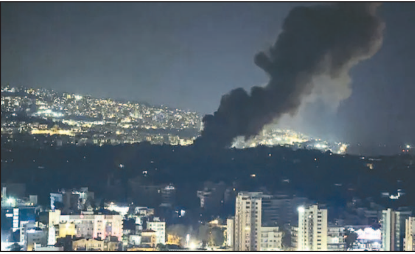
ଇସ୍ରାଏଲ ସେନା ପକ୍ଷରୁ ମଧ୍ୟ ପ୍ରାଚ୍ୟରେ ଇସ୍ରାଏଲମାନଙ୍କୁ ସୁରକ୍ଷିତ ରଖିବା ପାଇଁ ଆକ୍ରମଣ କରାଯାଇଛି । ଇରାନ ଉପରେ ସେମାନେ ମୁକ୍ତ ବୋଲି କୁହାଯାଇଛି । ଇରାନ ଉପରେ

ନୂଆଦିଲ୍ଲୀ, ୨୧୧୦ : ଇସ୍ରାଏଲ ଉପରେ ଇରାନର ଆକ୍ରମଣ ପରେ ଏବେ ମଧ୍ୟପ୍ରାଚ୍ୟରେ ଅଶାନ୍ତ ପରିବେଶ ସୃଷ୍ଟି ହୋଇଛି । ଇରାନର ୨୦୦ କ୍ଷେପଣାସ୍ତ୍ର ମାତ୍ରରେ ଏବେ ସମଗ୍ର ବିଶ୍ୱରେ ତୃତୀୟ ବିଶ୍ୱଯୁଦ୍ଧର ଆଶଙ୍କା ଦେଖାଦେଇଛି । ଏହାକୁ ନେଇ ଏବେ ସୋସିଆଲମିଡିଆରେ ଚର୍ଚ୍ଚା ଓ ଟ୍ରେଣ୍ଡ ଜୋର ଧରିଛି । ଇରାନର ମିଶାଇଲ ଆକ୍ରମଣ ପରେ ଦେଶର ନାଗରିକମାନେ ସୁରକ୍ଷିତ ଆଶ୍ରୟସ୍ଥଳ ଖୋଜୁଛନ୍ତି । ଇରାନ କହିଛି ଯେ ଏହି ଆକ୍ରମଣ ପାଇଁ ଇସ୍ରାଏଲ ଦାୟୀ । କମାଣ୍ଡର ଓ ଅନ୍ୟ ନେତାମାନଙ୍କୁ ମାରିବା ପରେ ଏଭଳି ଘଟଣା ସୃଷ୍ଟି ହୋଇଛି ।