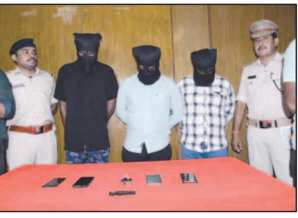
ଗିରଫ ତିନି ଲୁଚେଇ ଗଣବଳାକାର ଥାନା ଅନ୍ତର୍ଗତ ମହିଳା ରହୁଥିବା ଆପାର୍ଟମେଣ୍ଟରେ ଉଦ୍ଧୃତ ହେଲେ । ଏବେ ସେମାନଙ୍କ ମଧ୍ୟରୁ ଦୁଇଜଣ ନାୟକ ସେହି ଆପାର୍ଟମେଣ୍ଟରେ ରହୁଥିଲେ । ଗୁରୁତ୍ୱ ସହାୟତାରେ ତିନିଜଣ ମିଶ୍ରି ୨୮ ତାରିଖ ଦିନ ମୋବାଇଲ୍ ଲୁଚି