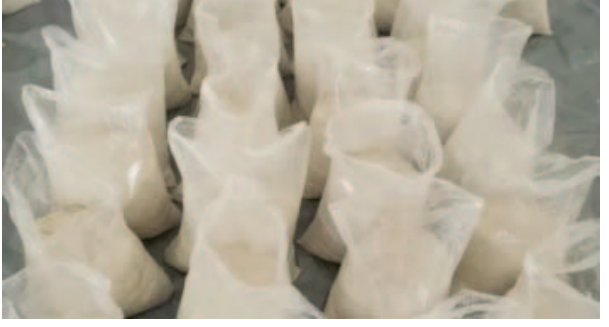
ବୋଲି ପୋଲିସ୍ ସୂଚନା ଦେଇଛି । ଏହି କୋକେନ୍ ଦୁଇ ହଜାର କୋଟିର କୋକେନ୍ ଯୋଜନା କରାଯାଇଥିଲା ।

ନୂଆଦିଲ୍ଲୀ, ୨୧୧୦ : ଦିଲ୍ଲୀ ପୋଲିସ୍ ୫୬୬ କେଜିର ପ୍ରାୟ ୨୦୦୦ କୋଟି ମୂଲ୍ୟର କୋକେନ୍ ଜବତ କରିଛି । ରାଜଧାନୀରେ ଏହା ଏକ ବଡ଼ ଧରଣର ନିଶାଦ୍ରବ୍ୟ ଜବତ । ଦକ୍ଷିଣ ଦିଲ୍ଲୀର ମେହେରାଉଳ ଅଞ୍ଚଳରେ ଏହି ନିଶାଦ୍ରବ୍ୟକୁ ଠାଉ କରାଯାଇଥିଲା । ଏହି ମାମଲାରେ ୪ ଜଣଙ୍କୁ ଗିରଫ କରାଯାଇଥିବା ପୋଲିସ୍ କହିଛି । ଆଫଗାନିସ୍ତାନର ଜଣେ ନାଗରିକ ଏହି ଦ୍ରବ୍ୟ ବିକ୍ରିକର୍ତ୍ତା ରଖିଥିଲେ ।