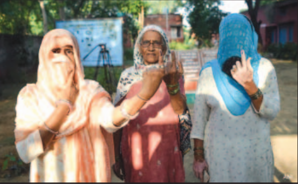
କୌଣସି ଦଳକୁ ଏଠି ସ୍ପଷ୍ଟ ବହୁମତ ମିଳୁନାହିଁ । ତେବେ କଂଗ୍ରେସ ଓ ଏନ୍‌ଡି

ନୂଆଦିଲ୍ଲୀ, ୫।୧୦ : ଜମ୍ମୁ-କାଶ୍ମୀର ଓ ହରିୟାଣା ବିଧାନସଭା ଲାଗି ନିର୍ବାଚନ ଶେଷ ହୋଇଛି । ୮ ଚାରିଖରେ ଭୋଟ ଗଣତି କରାଯିବ । ତେବେ ଭୋଟ ଗଣତି ପୂର୍ବରୁ ବିଭିନ୍ନ ସଂସ୍ଥା ପକ୍ଷରୁ ରୁଥି ବାହୁଡ଼ା ମତ ବା ଏକଜିଟ୍ ପୋଲ୍ ଆକଳନ ଆସିଛି । ଆକଳନ ଅନୁଯାୟୀ ହରିୟାଣାରେ ୧୦ ବର୍ଷ ଧରି କ୍ଷମତାରେ ଥିବା ବିଜେପି ଠାରୁ କଂଗ୍ରେସ କ୍ଷମତା ହତାଇ ନେବାକୁ ଯାଉଛି । ଜମ୍ମୁ-କାଶ୍ମୀରରେ ଝୁଲ୍ଲା ବିଧାନସଭା ହେବାର ସମ୍ଭାବନା ଦେଖାଦେଇଛି ।