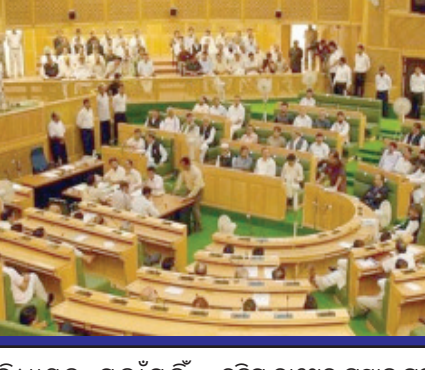
ବିଜେପି ବିଧାୟକ ମୁହାମ୍ମଦ୍ ହୋଇଛନ୍ତି । ପ୍ରଥମ ଦିନରେ ସମସ୍ତଙ୍କୁ ଚକିତ କରି ପିଟିପି ବିଧାୟକ ଖୁସିଦ ପାରା ଗୃହରେ ଧାରା ୩୭୦ ଉଦ୍ଧୃତ ବିରୋଧରେ ଗୋଟିଏ ପ୍ରସ୍ତାବ ଆଗତ କରିଥିଲେ । ପୁଣି ଏହାକୁ ଲାଗୁ କରିବାକୁ ସେ ଦାବି କରିଥିଲେ । ତେବେ ବିଜେପିର ବିଧାୟକମାନେ ଏପରି ପ୍ରସ୍ତାବକୁ କୋରଦାର ବିରୋଧ କରିଥିଲେ । ତାଙ୍କୁ ନିକଟିକ କରିବାକୁ ବାଚସ୍ପତିଙ୍କୁ କହିଥିଲେ । ବାଚସ୍ପତି

ଶ୍ରୀନଗର: ଦୀର୍ଘ ୬ ବର୍ଷ ପରେ ଜମ୍ମୁ-କଶ୍ମୀର ବିଧାନସଭାର ପ୍ରଥମ ଅଧିବେଶନ ଆଜି ଠାକୁ ଆରମ୍ଭ ହୋଇଛି । ନିକଟରେ ନିର୍ବାଚନ ଓ ସରକାର ଗଠନ ପ୍ରକ୍ରିୟା ଶେଷ ହେବା ପରେ ଆଜି ବିଧାନସଭା ଅଧିବେଶନ ବସିଛି । ହେଲେ ୬ ବର୍ଷ ପରେ ବସିଥିବା ବିଧାନସଭାର ପ୍ରଥମ ଦିନରେ ପ୍ରବଳ ହଜାମା ଦେଖିବାକୁ ମିଳିଛି । ନିୟମ ଅନୁସାରେ, ପ୍ରଥମ ଦିନ ଗୃହରେ ବାଚସ୍ପତି ନିର୍ବାଚନ ହୋଇଥିଲା । ଏନସିପି ବରିଷ୍ଠ ନେତା ତଥା ୬ଥର ବିଧାୟକ ରହି ମହାରାଷ୍ଟ୍ରର ବାଚସ୍ପତି ଭାବେ ନିର୍ବାଚିତ ହୋଇଛନ୍ତି । ମୁଖ୍ୟମନ୍ତ୍ରୀ ଓ ଶ୍ରୀନଗର ଅଧିକାରୀଙ୍କୁ ଓ ପ୍ରୋ ଟମ୍ପ ବାଚସ୍ପତି ମୁଦାରକ ଗୁଲ୍ ତାଙ୍କୁ ଶୁଭେଚ୍ଛା କରାଯାଇଛି । କିନ୍ତୁ ଏହାପରେ ଗୃହରେ ପ୍ରବଳ ହଜାମା ହୋଇଛି । ଜମ୍ମୁ-କଶ୍ମୀରରୁ ୨୦୧୯ ଅଗଷ୍ଟ ୫ରେ ଉଦ୍ଧୃତ ହୋଇଥିବା ଧାରା ୩୭୦କୁ ନେଇ ଗୃହରେ ପିଟିପି ଓ