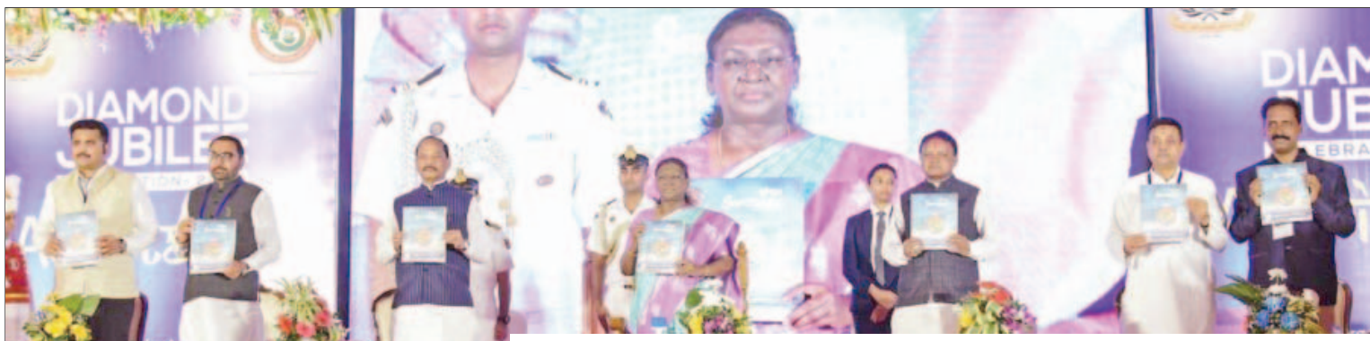
ପୁରୀ ଗୋପବନ୍ଧୁ ଆୟୁର୍ବେଦ ମହାବିଦ୍ୟାଳୟର ବାର୍ଷିକୀ ସମାରୋହ

ପୁରୀ, (ସବୁଧ୍ୟ) : ରାଷ୍ଟ୍ରପତି ଡ୍ରୌପଦୀ ମୁର୍ମୁ ରୂପବାର ପୁରୀରେ ଗୋପବନ୍ଧୁ ଆୟୁର୍ବେଦ ମହାବିଦ୍ୟାଳୟର ୭୫ତମ ବାର୍ଷିକ ଉତ୍ସବରେ ଯୋଗ ଦେଇଛନ୍ତି । ଏହି ଅବସରରେ ଉଦ୍‌ବୋଧନ ଦେଇ ରାଷ୍ଟ୍ରପତି କହିଥିଲେ ଯେ, ବର୍ତ୍ତମାନ ବିଜ୍ଞାନ ଓ ପ୍ରଯୁକ୍ତିବିଦ୍ୟାର ସମୟ । ଆର୍ଟିଫିସିଆଲ ଇଣ୍ଟେଲିଜେନ୍ସ, ମେସିନ୍ ଲର୍ଣ୍ଣିଂ, କ୍ୱାଣ୍ଟମ୍ କମ୍ପ୍ୟୁଟିଂ ଏବଂ ପ୍ରା-ତି ପ୍ରୁଷ୍ଟି ଭଳି ଟେକ୍ନୋଲୋଜି ଉଭୟ ଅଧ୍ୟୟନ ଓ ବିକାଶରେ ସହାୟକ ହେଉଛି । ଆମକୁ ବର୍ତ୍ତମାନର ଆବଶ୍ୟକତାକୁ ଚିହ୍ନିବାକୁ ହେବ ଏବଂ ଭବିଷ୍ୟତ ପାଇଁ ଯୋଜନା ପ୍ରସ୍ତୁତ କରିବାକୁ ହେବ । କିନ୍ତୁ ଆମର ଅତୀତକୁ ନ ଚାଣି ଆମେ ବର୍ତ୍ତମାନକୁ ରୁଝିପାରିବା ନାହିଁ କି ଭବିଷ୍ୟତ କାର୍ଯ୍ୟପଦ୍ଧତି ଗ୍ରହଣ କରିପାରିବା ନାହିଁ । ଆମର ଗୌରବମୟ ଅତୀତ