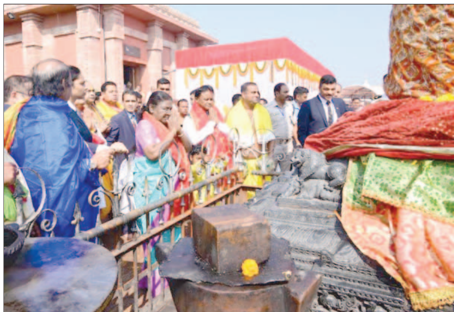
ପୁରୀ ଶ୍ରୀ ମନ୍ଦିରରେ ରାଷ୍ଟ୍ରପତି ଶ୍ରୀମତୀ ଦ୍ରୌପଦୀ ମୁର୍ମୁ ଓ ମୁଖ୍ୟମନ୍ତ୍ରୀ ଶ୍ରୀ ମୋହନ ଚରଣ ମାଝୀ ୪ ଡିସେମ୍ବର ୨୦୨୪