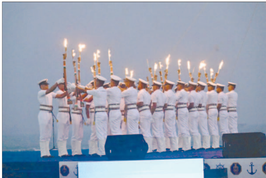
ପୁରୀ କୁୟାଗ ବିରରେ ସମରକୌଶଳ ପ୍ରଦର୍ଶନ କରୁଛନ୍ତି ନୌସେନା