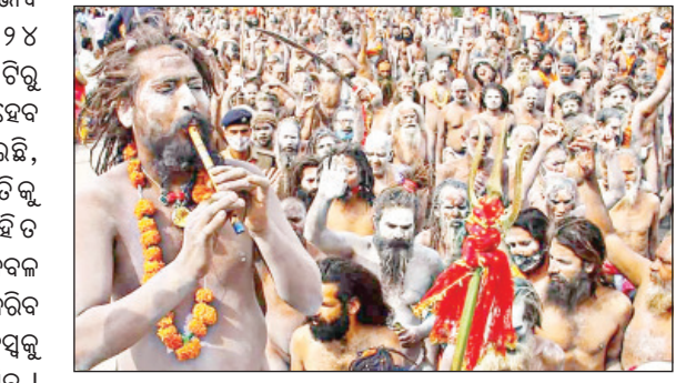
ମହାକୁମ୍ଭ ଜିତିପି ଆକଳନ ୧% ରୁ ଅଧିକ ବୃଦ୍ଧି କରିବ ବୋଲି ଆକଳନ କରାଯାଇଛି । ୨୦୨୩-୨୪ରେ ଭାରତର ଜିଡିପି ୨୯.୩୬ ଲକ୍ଷ କୋଟି ଟଙ୍କା ଥିବା ବେଳେ ୨୦୨୪-୨୫ରେ ଏହା ବୃଦ୍ଧି ପାଇ ୩୨୪.୧୧ ଲକ୍ଷ କୋଟି ଟଙ୍କାରେ ପହଞ୍ଚିବ ବୋଲି ଆକଳନ କରାଯାଇଛି । ଏହି ଅଭିଭୂତରେ ମହାକୁମ୍ଭ ସ୍ୱରୂପ ବୃଦ୍ଧି ଲୁଚା ଗ୍ରହଣ କରିବ ।

ଉତ୍ତରପ୍ରଦେଶ ସରକାରଙ୍କ ଆକଳନ ଅନୁଯାୟୀ, ଏହି ପ୍ରତିଯୋଗିତାରେ ୪୦ କୋଟିରୁ ଅଧିକ ଘରୋଇ ଓ ଅନ୍ତର୍ଜାତୀୟ ପର୍ଯ୍ୟଟକ ଅଂଶଗ୍ରହଣ କରିବେ । ଯଦି ପ୍ରତ୍ୟେକ ବ୍ୟକ୍ତି ହାରାହାରି ୫,୦୦୦-୧୦,୦୦୦ ଟଙ୍କା ଖର୍ଚ୍ଚ କରିବ, ତେବେ ସମୁଦାୟ ଖର୍ଚ୍ଚ ୪.୫ ଲକ୍ଷ କୋଟି ଟଙ୍କାରେ ପହଞ୍ଚିପାରେ । ଏହା ଦ୍ୱାରା ଗୃହ ନିର୍ମାଣ, ପରିବହନ, କ୍ୟାଟରିଂ, ହସ୍ତଶିଳ୍ପ ଓ ପର୍ଯ୍ୟଟନ ଭଳି ବିଭିନ୍ନ କ୍ଷେତ୍ର ଉପକୂଳ ହେବ । ଏହି ଖର୍ଚ୍ଚ ଜାନୁଆରୀ ଏବଂ ଫେବୃଆରୀ ମାସରେ ଯୋଜନାବିହୀନ ଅତିରିକ୍ତ ସ୍ୱରୂପ ବହନ କରେ ନାହିଁ ବରଂ ଏହାର ଏକ ଅର୍ଥନୈତିକ କାର୍ଯ୍ୟକ୍ରମକୁ ପ୍ରତିନିଧିତ୍ୱ କରେ ।