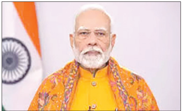
ପ୍ରଧାନମନ୍ତ୍ରୀ ମୋଦୀ କହିଥିଲେ, ବେଳେ ସୁଦୈର୍ଘ୍ୟ ଭାରତର ଏକ ଚିତ୍ର ମଧ୍ୟ ଦେଖୁଛି । ବିକଶିତ

ନୂଆଦିଲ୍ଲୀ: ଉଦ୍ଦିଷ୍ଟ ଭାରତ ମନ୍ତ୍ରପତି ଆମୋଦିତ ବିକଶିତ ଭୂମିଆ ଯଜ୍ଞ ଲିଡର୍ସ ଡାଏଲଗ ୨୦୨୪ କାର୍ଯ୍ୟକ୍ରମରେ ପ୍ରଧାନମନ୍ତ୍ରୀ ନରେନ୍ଦ୍ର ମୋଦୀ ଯୋଗ ଦେଇଥିଲେ । ସେ କହିଛନ୍ତି ଯେ ଦେଶର ସୁବର୍ଦ୍ଧନ ସହ ତାଙ୍କର ସମସ୍ତ ସମ୍ପର୍କ ସମ୍ପର୍କ ରହିଛି । ଦେଶର ସୁବର୍ଦ୍ଧନ ଶକ୍ତି ଭାରତକୁ ଯଥାସମ୍ଭବ ଏକ ବିକଶିତ ରାଷ୍ଟ୍ରରେ ପରିଣତ କରିବ ।