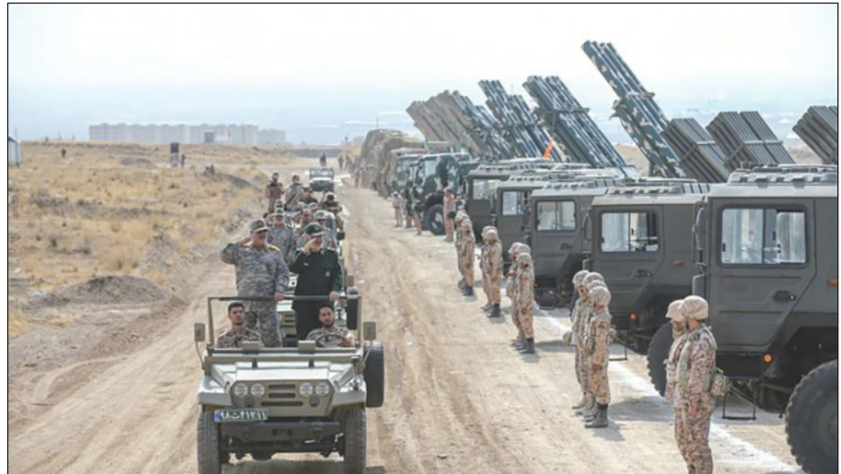
ଜେନେରାଲ ହୁସେନ ସଲାମୀ ଏବଂ ତ୍ରୁଗ୍ରେଡ଼ର ଜେନେରାଲ ଅମୀର ଅଲ୍ଲୀ ମିସାଇଲ ଉତ୍ସାର ବୁଲି ଦେଖିଥିଲେ । ଇରାନର ଏହି

ନୂଆଦିଲ୍ଲୀ : ଇରାନ ଦେଶର ମିସାଇଲ ଶୋ । ଯାହାକୁ ଦେଖି ଏବେ ପୁରା ଦୁନିଆ ଛାନିଆ । ମାଲ ମାଲ ନୂଆ ମିସାଇଲ ଆଉ ଅତ୍ୟାଧୁନିକ ଟ୍ରୋନରେ ତିଆରି ହୋଇଯାଇଛି ଇରାନର ମିସାଇଲ ସିଟି । ଯାହା ଦେଖିଲା ବେଳକୁ ଆତମିତ ଲାଗୁଛି । ଇସ୍ରାଏଲ ସହ ଚିତ୍ରତା ଭିତରେ ମିସାଇଲ ସିଟିର ଭିତର ସାମ୍ନାକୁ ଆଣିଛି ଇରାନ । ଇରାନର ଇସ୍ରାଏଲିକ ବିରୋଧୀମାନଙ୍କୁ ଗାତ୍ର ପୁ ଏହି ଭିତର ଛାଡ଼ି ଦେଇଛି ।