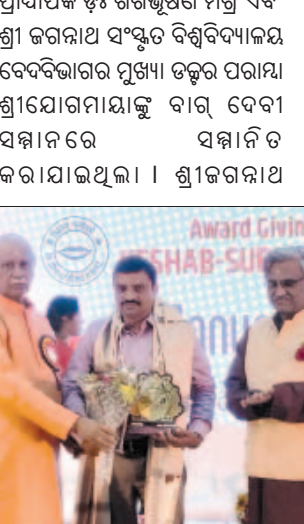
କେଶବ ସୁଭଦ୍ରା ପ୍ରତିଷ୍ଠାନ ଏବଂ ତାପୋଡିଲ୍ ପ୍ଲେ ସ୍କୁଲର ବାର୍ଷିକ ଉତ୍ସବ

ପୁରୀ, (ସବୁ୍ୟ): କେଶବ ସୁଭଦ୍ରା ପ୍ରତିଷ୍ଠାନ ଏବଂ ତାପୋଡିଲ୍ ପ୍ଲେ ସ୍କୁଲର ମିଳିତ ଆନୁଷ୍ଠାନିକ ଲିଲ୍ଲା ସଂସ୍କୃତି ଲବନ ପରିସରରେ ବାର୍ଷିକ ଉତ୍ସବ ହୋଇଥିଲା । ଉତ୍ସବରେ ବିଭିନ୍ନ ପ୍ରତିଭା ଗଣକୁ ପୁରସ୍କୃତ ଓ ସମ୍ମାନିତ କରାଯାଇଥିଲା । ସେମାନଙ୍କ ମଧ୍ୟରେ ବାଳ ଦେବୀ ସମ୍ମାନ, ଶିଳ୍ପୀ ସମ୍ମାନ, ସୃଷ୍ଟିକା ସମ୍ମାନ ଓ ଗବେଷଣା ପୁରସ୍କାରରେ ପୁରସ୍କୃତ ଓ ସମ୍ମାନିତ କରାଯାଇଥିଲା । ପରେ କେନ୍ଦ୍ରୀୟ ସଂସ୍କୃତ ବିଶ୍ୱବିଦ୍ୟାଳୟ