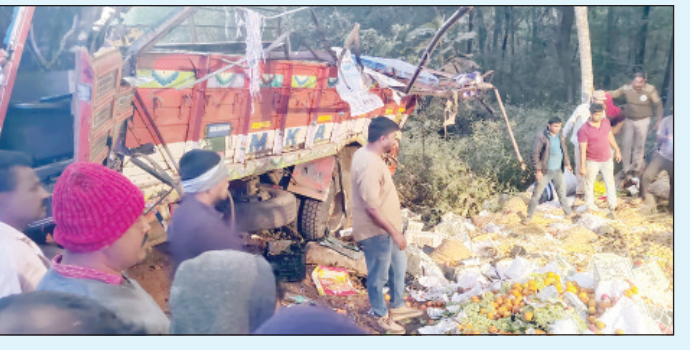
ଟିପ୍ପରକୁ ଧକ୍କା ଦେଲା ଟ୍ରକ, ଯାହାଫଳରେ ଗଭୀର ଖାଇଲେ ଖସି ପଡ଼ିଥିଲା । ପନିପରିବା ବୋହେଜେ ଟ୍ରକଟି ୫୦ ମିଟର ଦୂରତାରେ ମୃତାହତମାନଙ୍କର, ସମସ୍ତେ

ଯାଲାପୁରା: କର୍ଣ୍ଣାଟକର ଯାଲାପୁରା ରାଜପଥରେ ଏକ ଭୟଙ୍କର ସଡ଼କ ଦୁର୍ଘଟଣା ଘଟିଛି । ଯାଲାପୁରା ରୁଲ୍ଡାପୁରାରେ, ପନିପରିବା ବୋହେଜେ ଏକ ଟ୍ରକ ନିୟନ୍ତ୍ରଣ ହରାଇ ଏକ ଟ୍ରପର ସହିତ ଧକ୍କା ହୋଇଥିଲା । ଏହି ଦୁର୍ଘଟଣାରେ ୧୧ ଜଣଙ୍କର ମୃତ୍ୟୁ ହୋଇଛି ଏବଂ ୧୦ ଜଣ ଆହତ ହୋଇଛନ୍ତି । ଜଣେ ପୁଲିସ ଅଧିକାରୀ କହିଛନ୍ତି ଯେ ଆଜି ସକାଳେ ଦିଲ୍ଲି ପନିପରିବା ବେପାରୀ ଏକ ଟ୍ରକରେ ସେମାନଙ୍କ ପନିପରିବା ନେଇ ଯାଉଥିଲେ । ଏହି ଟ୍ରକ ନିୟନ୍ତ୍ରଣ ହରାଇ ଏକ