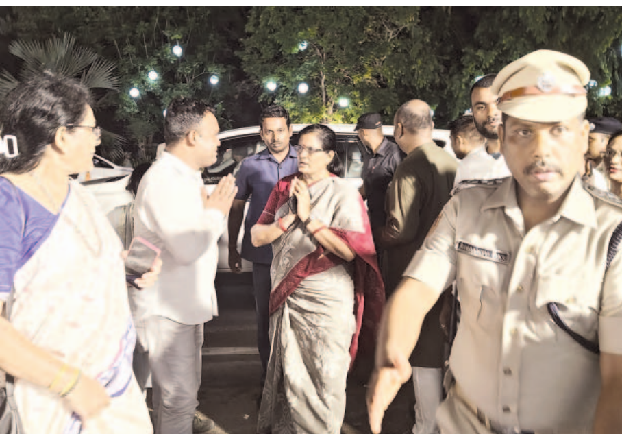
ଉପମୁଖ୍ୟମନ୍ତ୍ରୀ ପ୍ରଭାତୀ ପରିଡା