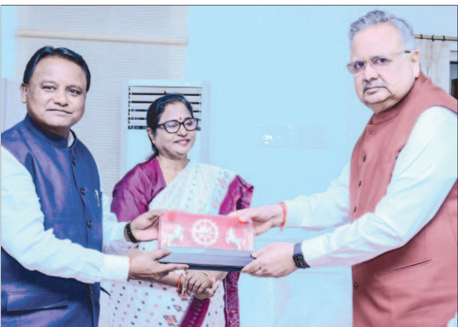
ଛତିଶଗଡ଼ ବିଧାନସଭାର ବାଚସ୍ପତି ଡ. ରମଣ ସିଂହ ମୁଖ୍ୟମନ୍ତ୍ରୀ ମୋହନ ଚରଣ ମାଝୀ ଓ ବାଚସ୍ପତି ଶ୍ରୀମତୀ ସୁରମା ପାଢ଼ୀଙ୍କ ସହିତ ସୌଜନ୍ୟମୂଳକ ସାକ୍ଷାତ କରୁଛନ୍ତି ।