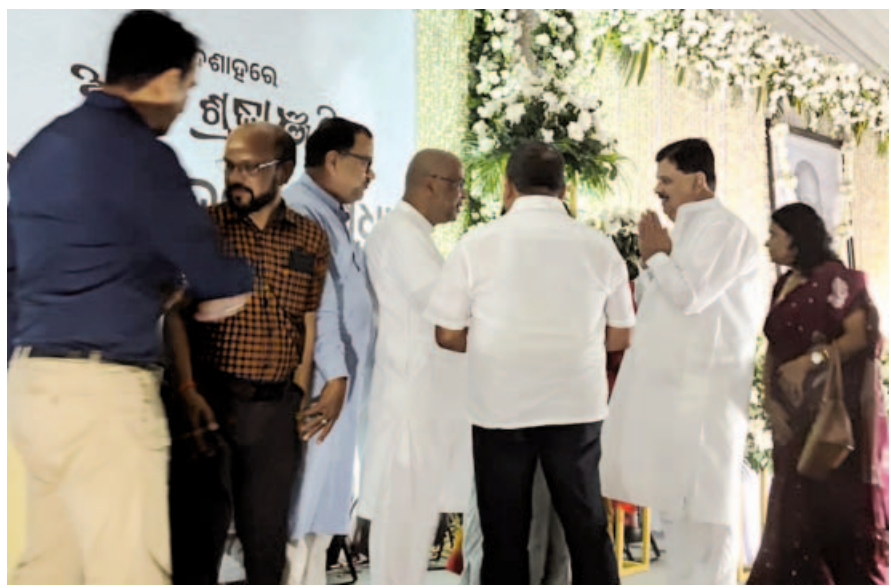
ପୂର୍ବତନ ବିଧାୟକ ତିରଞ୍ଜୀବ ବିଶ୍ୱାଳ