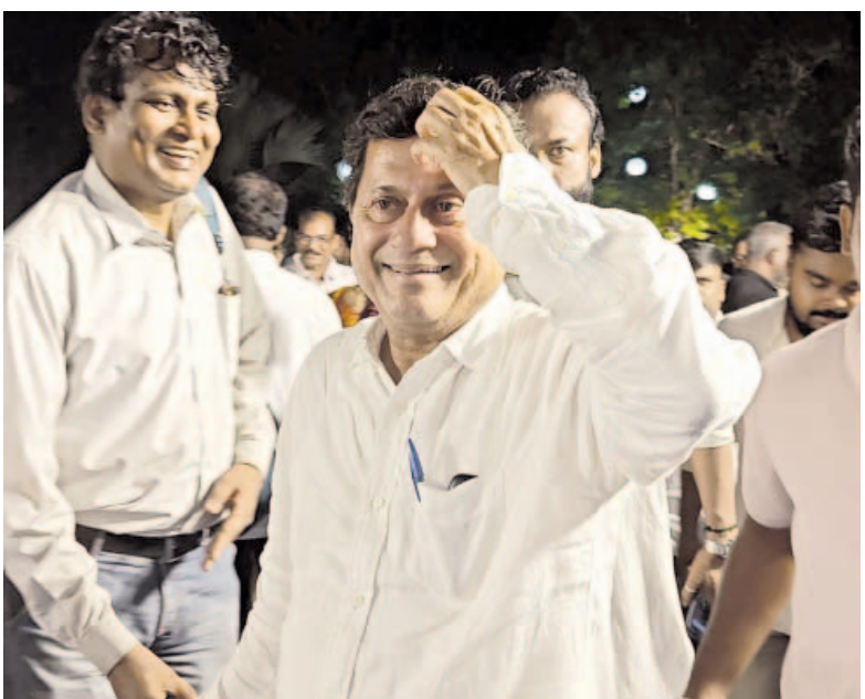
କିର, କିଏ ପ୍ରତିଷ୍ଠାତା ଅଭ୍ୟୁତ ସାମନ୍ତ