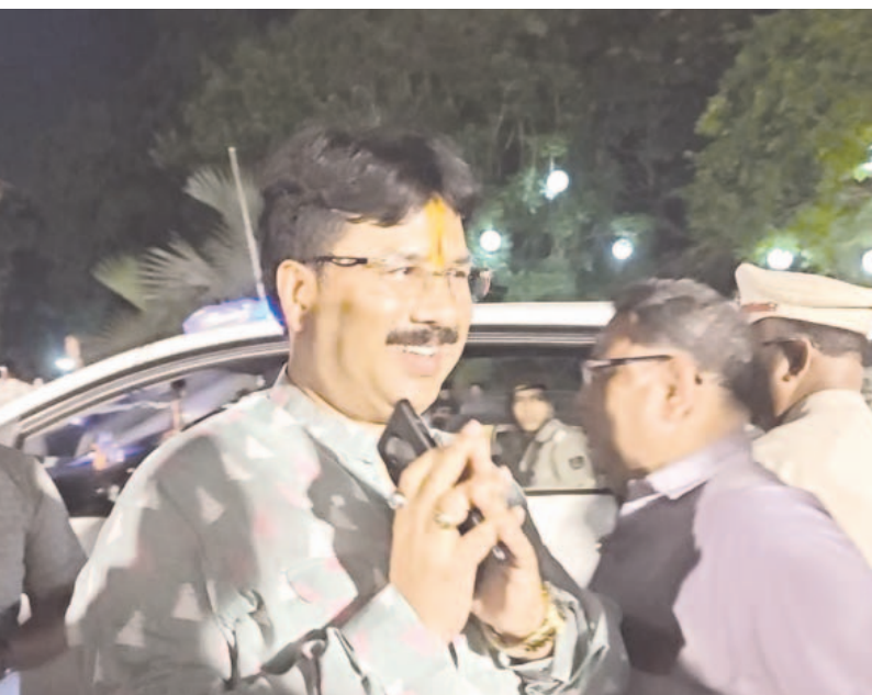
ନବରଞ୍ଜନ ମନ୍ତ୍ରୀ କୃଷ୍ଣଚନ୍ଦ୍ର ମହାପାତ୍ର