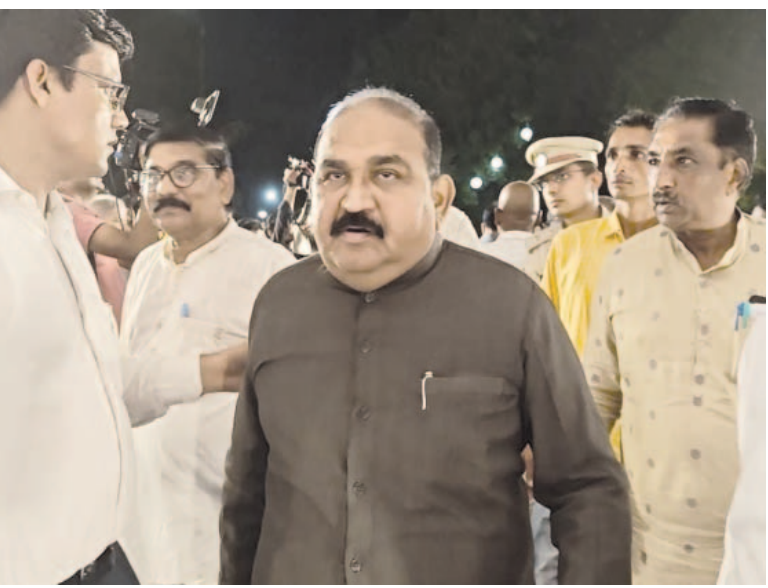
ବିଧାୟକ ଜୟନାରାୟଣ ମିଶ୍ର