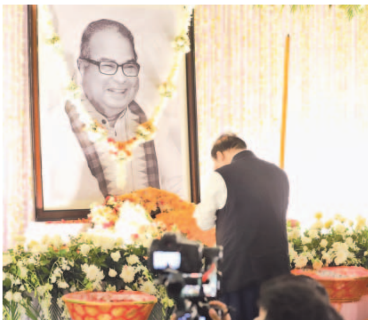
ଆସାମ ମୁଖ୍ୟମନ୍ତ୍ରୀ ହିମତ ବିଶ୍ୱଶର୍ମା

ପୂର୍ବତନ ପ୍ରଧାନ ୧୯୮୦ ମସିହାରେ ରାଜନୈତିକ କ୍ୟାରିୟର ଆରମ୍ଭ କରି ମଣ୍ଡଳ ସଭାପତିରୁ କେନ୍ଦ୍ରମନ୍ତ୍ରୀ ପର୍ଯ୍ୟନ୍ତ ଯାତ୍ରା କରିଥିବା ଏହି ରାଜ୍ୟବାଦୀ ମଣିଷ ଓଡ଼ିଶା ପାଇଁ ଛାଡ଼ି ଯାଇଛନ୍ତି ଅସୁମାରୀ ସ୍ୱପ୍ନ, ଆକାଂକ୍ଷା ଓ ଅଭିକାଞ୍ଚା । ଓଡ଼ିଶା ରାଜ୍ୟପତି ବିକାଶର ଏହି ଅଗ୍ରଦୂତ ଆମ ପାଇଁ ଲକ୍ଷ୍ୟ ଧାର୍ଯ୍ୟ କରି ଯାଇଛନ୍ତି । ଦଳନୀୟତା ଭିତରେ ଆବଦ୍ଧ ନ ରହି ସାମୁହିକ ଭିତ୍ତିରେ ସର୍ବଦା କାର୍ଯ୍ୟ କରିବାକୁ ଏହି ନିଷ୍ଠାପର ଜନସେବକ ପ୍ରୋତ୍ସାହ ଦେଇ ଯାଇଛନ୍ତି । ୧୯୪୧ ରୁ ୧୯୬୧ରେ କଳ୍ପିତ ଦିବ୍ୟଗତ ପ୍ରଧାନଙ୍କ ପ୍ରଦେଶ, ତ୍ୟାଗ, ନିଷ୍ଠାପର ଉଦ୍ୟମ ଯୋଗୁଁ ଆଜି ରାଜ୍ୟ ଓ ଦେଶରେ ବିଜେପି ଏକାଦଶାହରେ ପହଞ୍ଚିଛି । ସେ ଥିଲେ ରାଜ୍ୟ ବିଜେପିର ପ୍ରମୁଖ ବିନ୍ଧାଣୀ । ଯେଉଁ ସମୟରେ ରାଜ୍ୟରେ ଦଳର କୌଣସି ସ୍ଥିତି ନଥିଲା ସେତେବେଳେ ସେ ଦଳକୁ ମଝକୁତ କରିବା ପାଇଁ ଲାଗି ପଡ଼ିଥିଲେ । ସେ ବିଜେପିର ଯେଉଁ ବୀଜ ବଫଳ କରିଥିଲେ । ଆଜି ତାହା ଦେଶ ଏବଂ ରାଜ୍ୟରେ ବିଚାର ଦୃଷ୍ଟିରେ ପରିଣତ ହୋଇଛି । ଏହି ଦଳ ଜନସେବାକୁ ବ୍ରତ କରି ଦେଶର ବିକାଶକୁ ଆଗେଇ ନେଇଛି ।