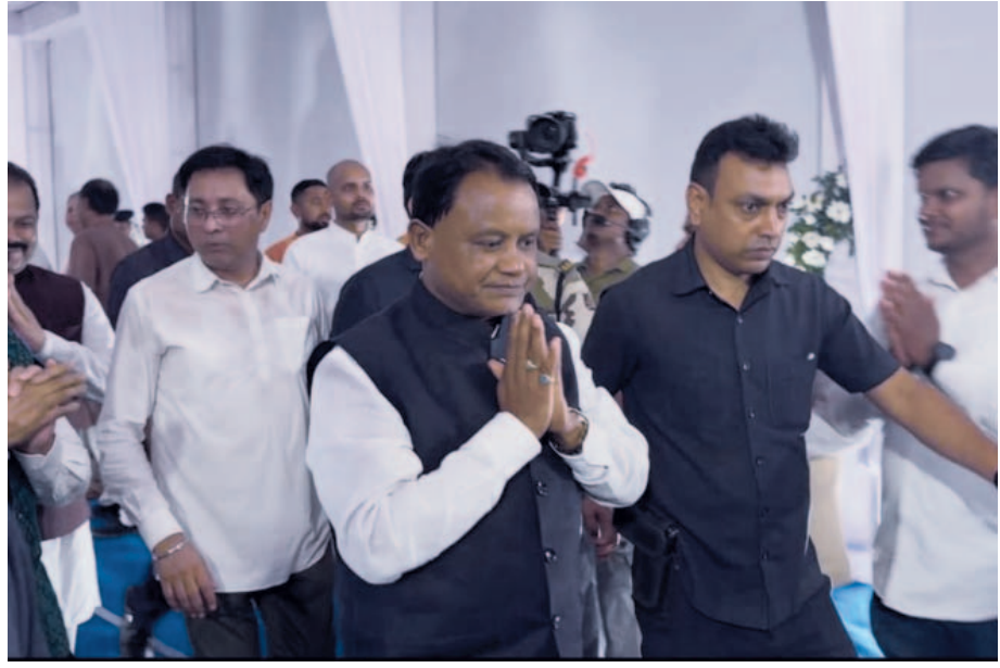
ଶ୍ରଦ୍ଧାପୂଜନ ଅର୍ପଣ କରୁଛନ୍ତି ମୁଖ୍ୟମନ୍ତ୍ରୀ ମୋହନ ଚରଣ ମାଝୀ