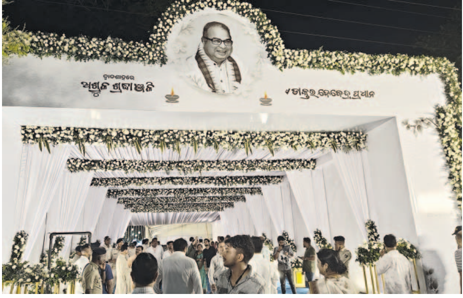
ଶ୍ରଦ୍ଧାଞ୍ଜଳି କାର୍ଯ୍ୟକ୍ରମ ସ୍ଥଳର ମୁଖ୍ୟ ପ୍ରବେଶ ପଥ