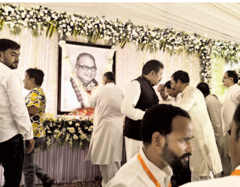
ପୂର୍ବତନ ସାଂସଦ ତଥା ବରିଷ୍ଠ ନେତା ରଞ୍ଜୀବ ବିଶ୍ୱାଳ