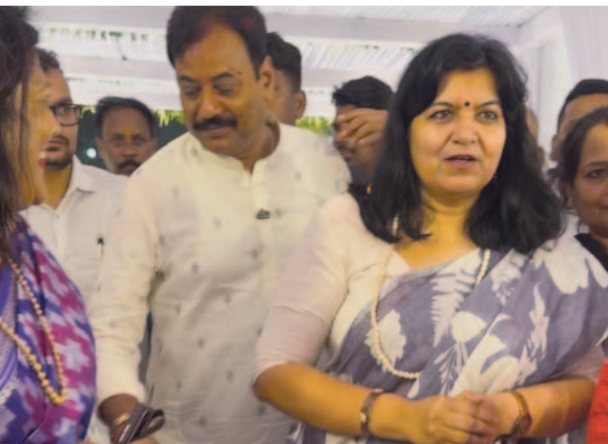
ସାଂସଦ ଅପରାଜିତା ଷଡ଼ଙ୍ଗୀ