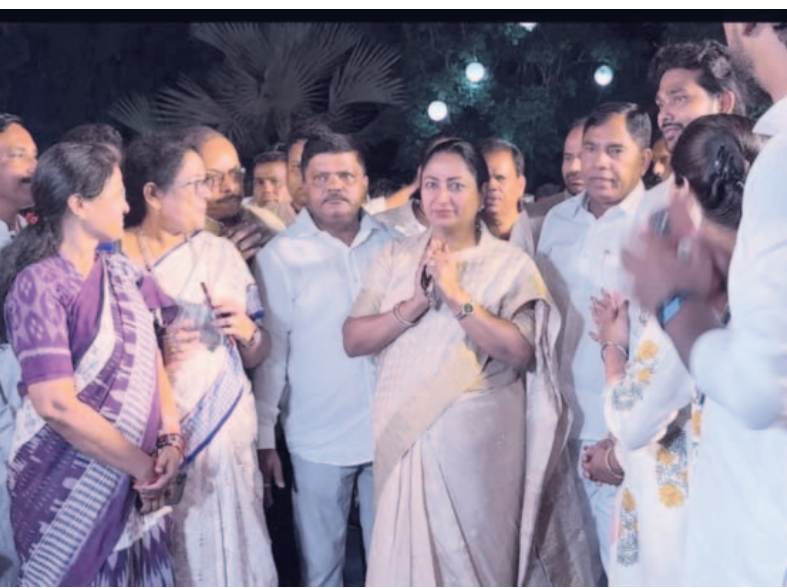
ବିଜ୍ଞା ମୁଖ୍ୟମନ୍ତ୍ରୀ ରେଖା ଗୁପ୍ତା